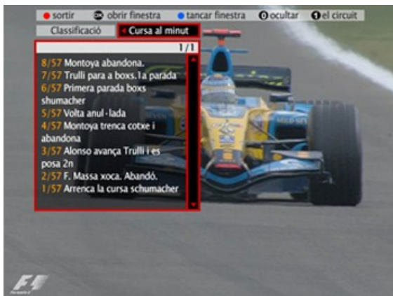
Información extra, sobre un deporte