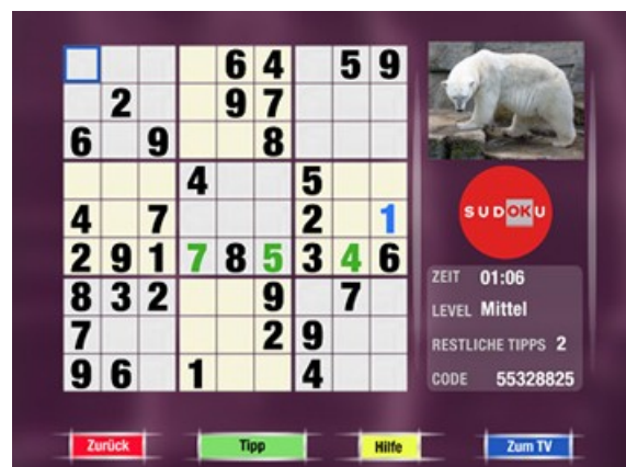
Juegos mientras se ve la TV