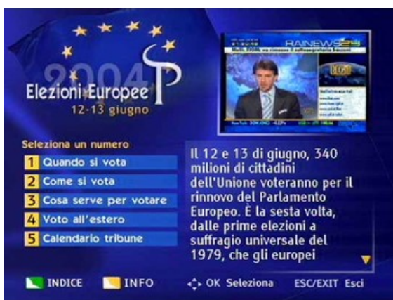
Portal especial de las Europeas en 2004